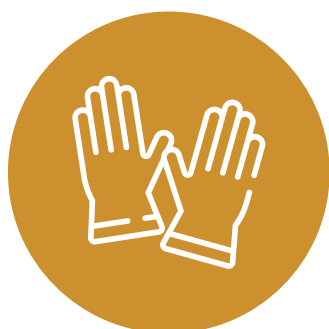
USO DE GUANTES