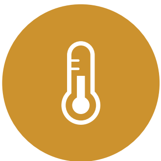
TOMA DIARIA DE LA TEMPERATURA DEL PERSONAL