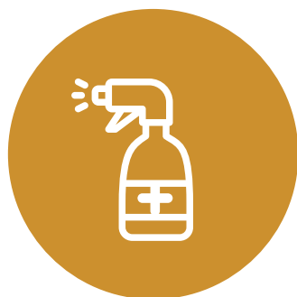
DESINFECCIÓN DE ESPACIOS DE TRABAJO