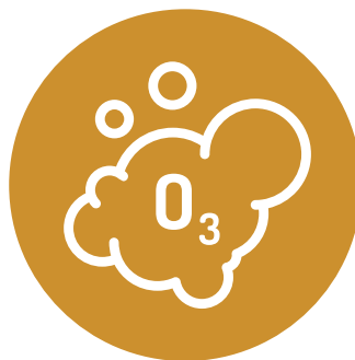
DESINFECCIÓN DIARIA CON OZONO DEL ESPACIO